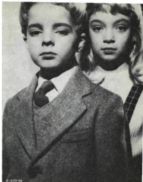
Village of the Damned , de Wolf Rilla

Un autre auteur anglais de science-fiction, Brian Aldiss, a bien souligné le contraste de cette transposition. Répondant à une demande de la revue italienne Cinema Domani , il écrit : "La plus grande partie de mes oeuvres ne se porterait pas aisément à l'écran. En effet, j'ai un sens pictural (au sens littéraire du terme) assez dévelop-