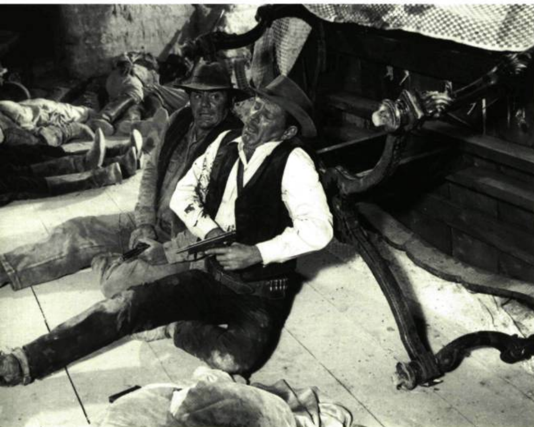
Ernest Borgnine et William Holden

aucun doute de démythifier le western sentimental avec tous ses nobles héros. Il réussit à détruire le mythe, mais avait-il besoin pour le faire d'être si violent?»