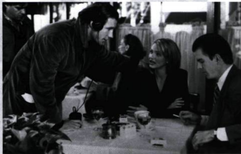
She's the One

bafoués et la nouvelle élite américaine, les maîtres de Wall Street, échoue lamentablement dans son effort d'établir une interaction sociale significative. Dans un autre registre, L'Élève (Olivier Schatzky, France) nous a étonné par sa description éloquent de la décadence d'une famille aristocratique française de la fin du 19 e siècle. La caméra de Schatzky, par ses plans en constant déséquilibre, illustre une société sur le point de vaciller. Ainsi, dès son arrivée dans la grande maison «fragilisée», le jeune précepteur (Vincent Cassel) qui, espère-t-on, va mettre de l'ordre dans la vie de l'enfant surdoué de la famille, casse un bibelot. La suite de la mise en scène, justement primée par le jury, s'appliquera à donner suite à cet objet cassé en