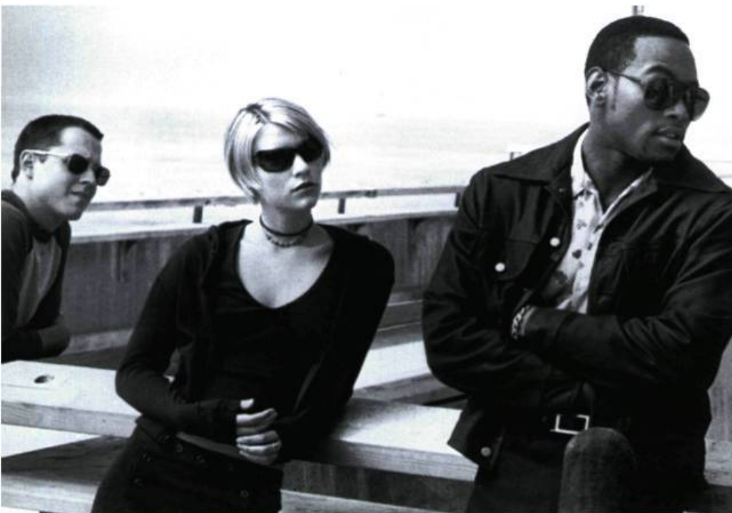
The Mod Squad

les, particulièrement lorsque Judge s'attaque aux travers du quotidien (le trafic du lundi matin, les logements aux murs de carton) ou de la vie corporative (les photocopieurs toujours brisés, les réceptionnistes à la voix horripilante). Mais ce n'est pas suffisant pour soutenir notre intérêt pendant une heure et demie, et on se dit que Judge aurait dû en tirer une demi-heure télé.