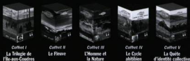
Coffret I La Trilogie de l'île-aux-Coudres

L'œuvre complète d'un cinéaste phare de l'ONF en 5 coffrets.