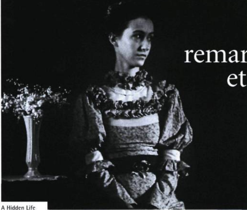
A Hidden Life