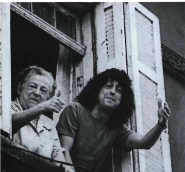
Durval Discos, également présenté dans la section Cinémas d'Amérique latine

musique techno y célèbre l'union entre la jeunesse de la classe dominante et ses semblables déshérités.