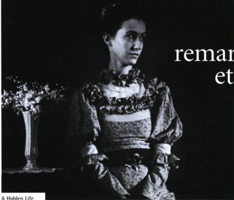
A Hidden Life