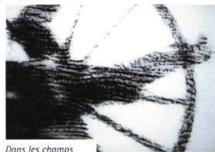
Dans les champs