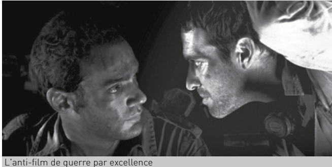
L'anti-film de guerre par excellence

Né à Tel-Aviv en 1962, Samuel Maoz a réalisé quelques courts métrages, entre 1987 et 2000, et de nombreuses publicités. En 1982, il est mobilisé comme artilleur dans les divisions blindées. Du Liban, Maoz est revenu hanté par ce qu'il a fait, par ce qu'il a vu. Lebanon , qui a obtenu le Lion d'or au dernier festival de Venise, retrace l'expérience personnelle de ce soldat israélien qu'était à l'époque le cinéaste. Par quel exorcisme, par quelle magie se sort-on d'un tel traumatisme : par l'écriture, par la peinture, par le cinéma lorsqu'on est cinéaste ?