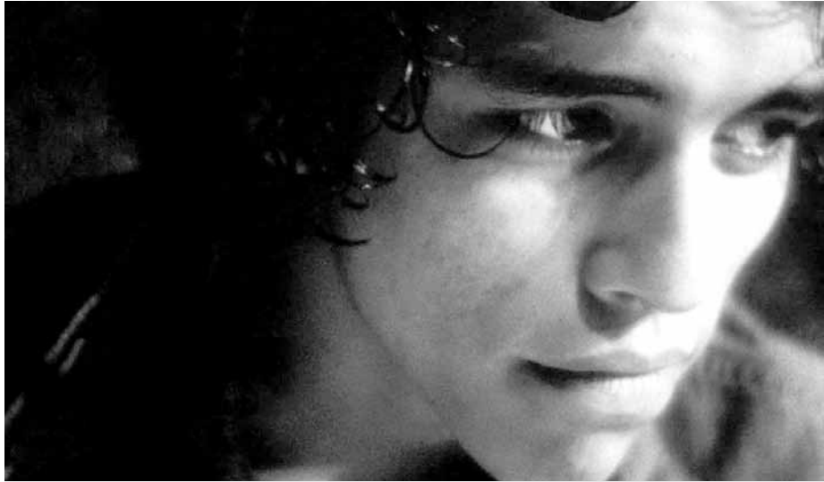
La fureur provocatrice de Genet

Avec Mala Noche et l'adresse de Gus Van Sant, le cinéma gai quitte la fresque naturaliste et exalte le bonheur de la chair. En s'inspirant d'auteurs du passé, le réalisateur brode une imagerie homoérotique où le gai devient un potentiel créatif, une puissance à libérer. Il étale sans attendre les noirs et blancs expressionnistes de l'avant-garde, ainsi que la fureur provocatrice de Genet.