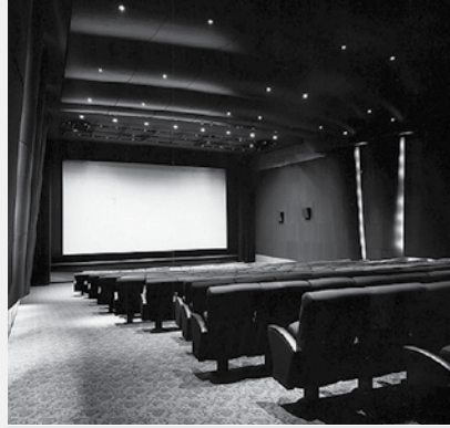
Prochaine réouverture de la salle Cassavetes