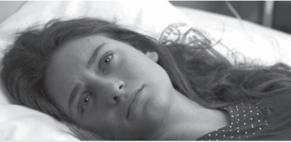
Là où le feu brûle