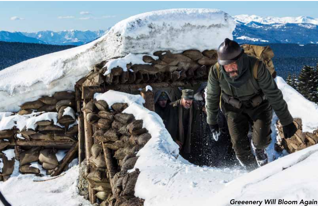
Greenery Will Bloom Again

les voix des peuples autochtones a trouvé un fort écho en Compétition, puisque trois films en faisaient l'objet. Nobody Wants the Night , de l'Espagnole Isabel Coixet (présenté en ouverture), donnait la part belle à une Esquimaude, fort bien rendue par l'actrice japonaise Rinko Kikuchi. El botón de nácar , Ours d'argent du meilleur scénario, faisait entendre la langue parlée par les 20 derniers autochtones de Patagonie. Pour sa part, Volcan (Ixcanul) , de Jayro Bustamante – récipiendaire du Prix Alfred-Bauer –, s'attardait à la langue des peuples kaqchikels mayas habitant les hauts-plateaux du Guatemala et victimes d'un racisme orchestré en douce par l'État. Le racisme forme également le cœur Salutations! (d' Aferim! ), de Radu Jude, mélange de road movie en noir et blanc et de chasse à l'homme dans la Roumanie du début du 19 e siècle, où un gendarme et son fils poursuivent un esclave rom fugitif. Le film explore les préjugés racistes qui avaient et ont encore cours envers les Roms, autochtones d'Europe ostracisés depuis des siècles. Superbement tourné et joué, le film s'est mérité l'Ours de la Meilleure réalisation, partagé avec Body de Malgorzata Szumowska. Autre beau film sur la perte et l'absence, 45 Years , d'Andrew Haigh, a vu Charlotte Rampling et Tom Courtenay récompensés avec les deux Ours d'argent des meilleurs acteurs, fort mérités dans les deux cas.