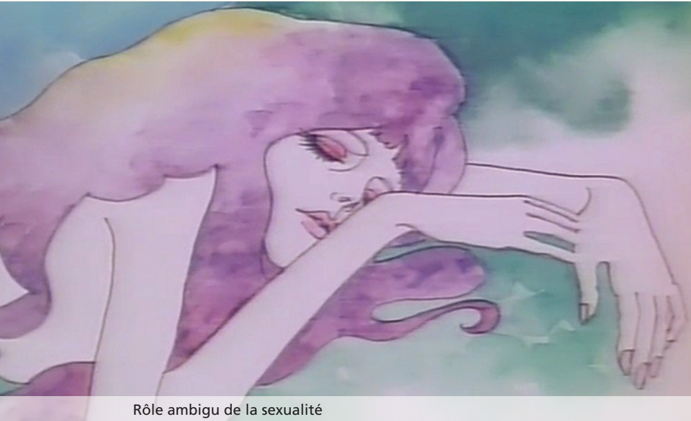
Rôle ambigu de la sexualité

hétéroclite de l'ensemble en mettant toujours ses propositions graphiques au service des sentiments ressentis par son personnage. Cependant, ces bonnes intentions sont aussi une belle occasion pour proposer au public une avalanche de dessins érotiques, ce qui ne va pas sans une certaine ambiguïté. S'il prend des allures de manifeste féministe, le film est surtout l'occasion de montrer le plus de sexe possible à l'intention d'un public pas forcément porté à défendre la cause des femmes. De plus, le rôle de la sexualité est également ambigu. Le film commence par nous montrer une jeune femme qui n'a aucun contrôle sur sa sexualité (elle est déflorée le jour de son propre mariage par le seigneur des lieux). Le sexe est donc l'instrument de la tyrannie... avant d'être clairement vu comme l'instrument du diable, et enfin un outil de libération face à l'oppression.