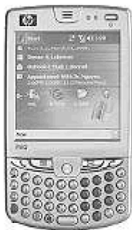
Figure 1. Ordinateur de poche HP-hw6510

Les PDA des patients offrent quatre fonctions principales : (1) consultation de la liste d'AVQ (Activités de la Vie Quotidienne) à réaliser durant les quatre heures suivantes, (2) évaluation de la fréquence et de l'intensité des symptômes, (3) évaluation du PDA et (4) demande d'assistance. La figure 2 (page suivante) permet de visualiser des exemples d'écrans tels qu'ils sont disponibles sur les agendas distribués aux participants.