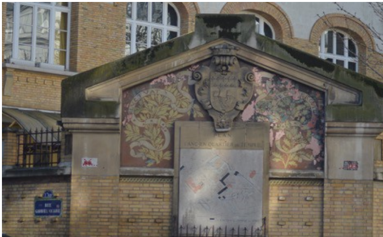
Illustration 2: Paris Fluctuat nec mergitur

Leur nihilisme vise notre société en son cœur de tolérance et de libre communication. André Glucksmann, penseur de la guerre disparu quelques jours avant l'événement, s'était penché sur cette question : « Qui est prêt à se sacrifier lui-même s'estime digne de sacrifier autrui. Le terrorisme s'élève ainsi à une " mystique ", " une possession absolue de soi ", " une extase vers le bas ", prêche Tchen dans La Condition humaine , où Malraux fait écho à Dostoïevski 4 . »