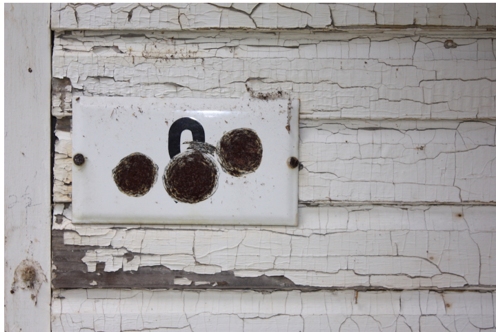
FIGURE 1 : Photographie de Louise Lachapelle

L'article qui suit prend forme depuis les matériaux et l'atelier d'un petit livre en cours de réalisation, Le coin rouge , un essai_maquette sur la création, ses processus, ses objets. Amorcé par un retour sur un corpus de travaux, de relations et d'expériences liés à la maison 1 , ce geste est aussi fait des