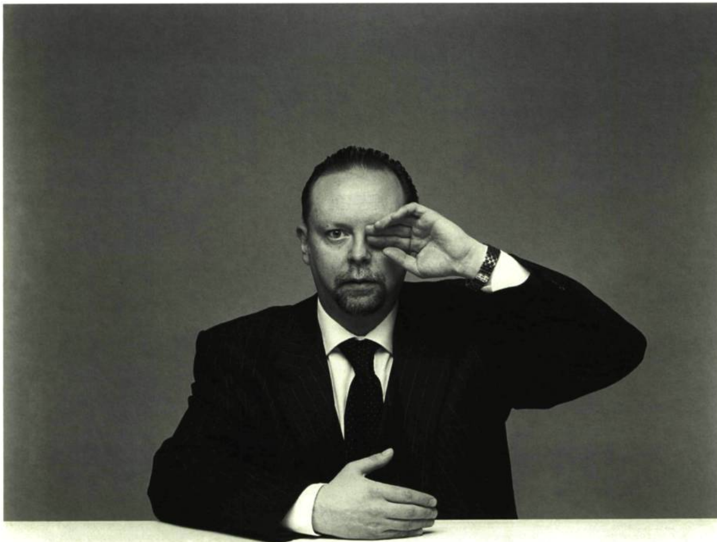
Moscou, 31 décembre 1999, de la série Événements d'Olivier Christinat, 2000