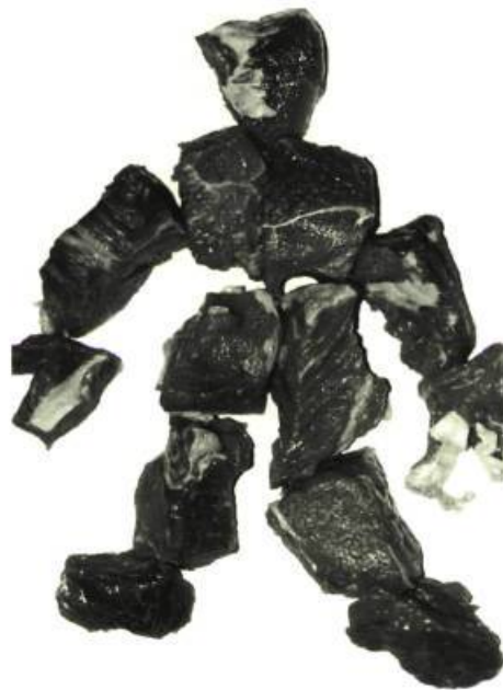
Parfum et blessure de F. et B. Haxhillari, 2001

passé « maître dans l'art de foutre le bordel », prend en charge la narration et place le roman sous le signe de l'ironie et de la révolte tributaires d'une intelligence et d'une conscience aiguës. « Peiné de réaliser [...] à quel point elle est tarée, l'espèce humaine », Larry tente de s'en préserver en s'enfermant à l'intérieur de lui-même, dans sa « cabane », avec ses fantasmes, ses hallucinations et sa fureur. Sa résistance, au pouvoir certes — comme en témoigne son identification à la