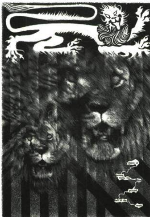
Dante's Inferno (extrait) de Tom Phillips, 1985