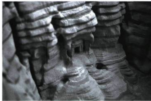
Guy Laramée, Biblios (détail).

politique, il reste que son potentiel intellectuel n'a pas encore été entièrement déployé : il semble que les Américains aient mal politisé la théorie française, ne retenant qu'une partie de la complexité des rapports interhumains et les microfascismes qui peuvent en découler dans l'ordre du monde orienté non plus par la domination mais par le contrôle.