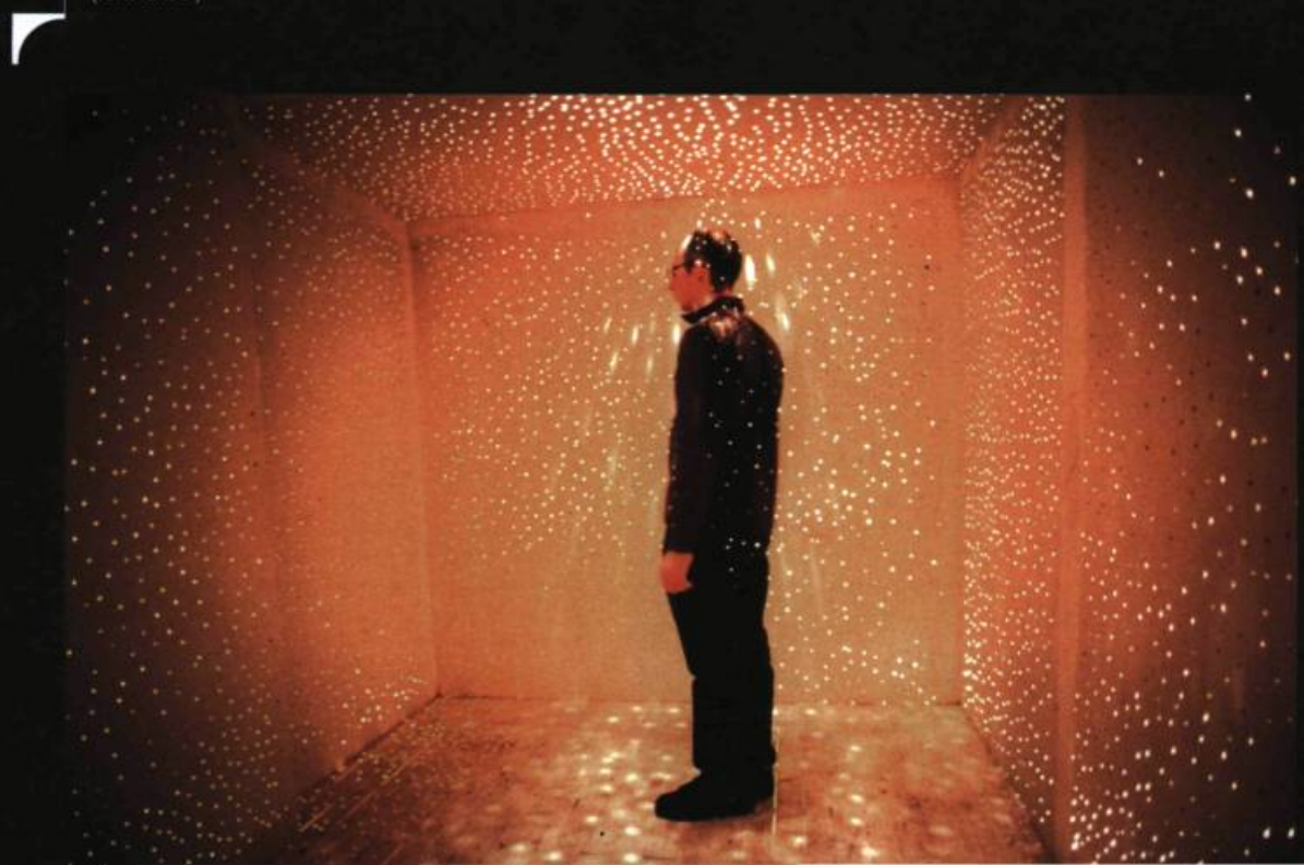
Samuel Roy-Bois. J'ai entendu un bruit, je me suis sauvé (2003) Panneaux de gypse, bois, peinture et système d'éclairage (16' x 12' x 8')