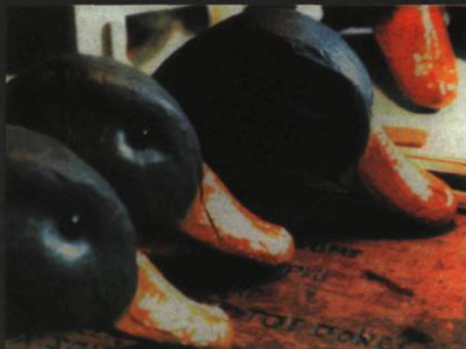
Jean-Jules Soucy, Vol de canards , (1987). Photo : Jean-Jules Soucy