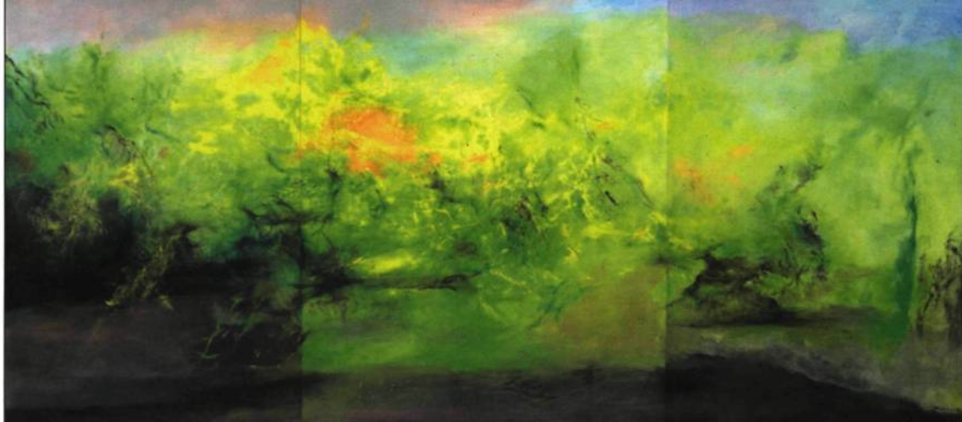
Zao Wou-Ki, Hommage à mon ami Jean-Paul Riopelle — Histoire de deux érables canadiens (21.06.2003), 2003 Huile sur toile, triptyque, 195 x 420 cm. Collection particulière.