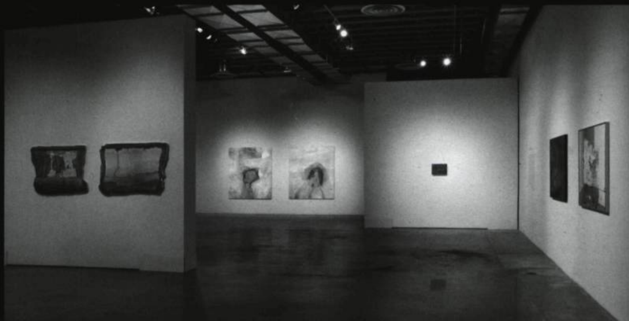
Nicolas Baier, vue d'installations. Paréidolies, MOCCA, Toronto, Hiver 2009.

Une autre boucle est ainsi bouclée. Encore une fois, Nicolas Baier donne à voir et apprend à regarder. Il tend ses fabuleux miroirs, propose ses brillants reflets, soumet ses pénétrantes réflexions. On est alors tenté de pousser l'allégorie centrale de cette production en référant aux neurones miroirs, ces unités fonctionnelles du système nerveux qui sont supposées jouer un rôle dans l'apprentissage par imitation. Ces neurones s'activent quand un individu en voit un autre réaliser la même action que celle pour laquelle elles se mettent en branle quand lui-même la pratique, d'où l'effet miroir. Selon certaines hypothèses des neurosciences, ces cellules pourraient jouer un rôle dans l'empathie, le dégoût, la cognition sociale, y compris le langage, l'intercompréhension et bien sûr dans l'art, ce miroir embué tendu à notre société... ☞