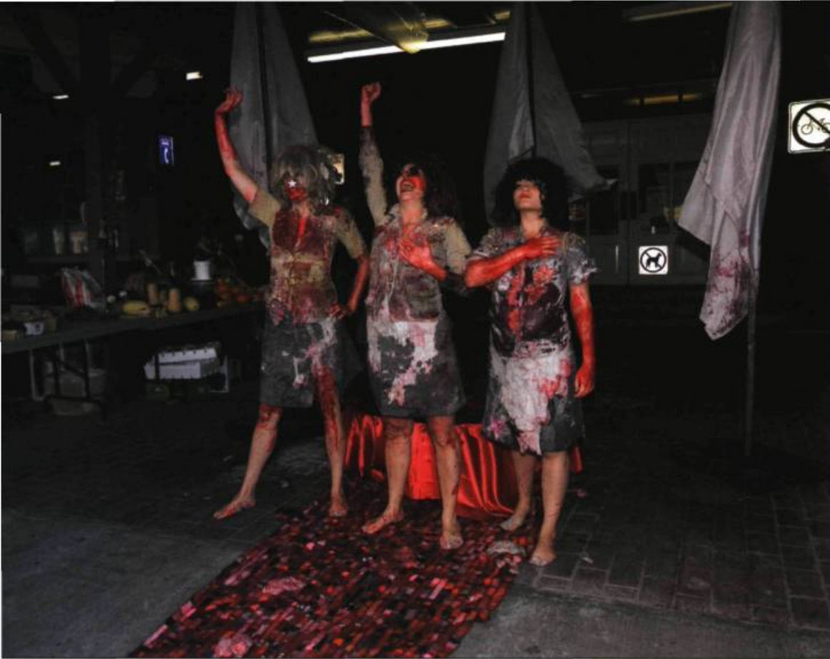
Les Fermières obsédées, Le rodéo, le goinfre et le magistrat , 2006 Performance.

si loin de Derrida quoi qu'il ait pu en dire. Le dépassement ne menace pas la structure incriminée ni ne dissipe une complicité binaire, voilée sous la guise de l'irréductibilité, qui maintient la structure et en prolonge la stérilité. Rien ne sert d'agiter les eaux stagnantes, la sauvegarde consiste à s'en extraire, prendre du recul, analyser les situations et montrer en quoi elles sont pernicieuses : lorsque, par exemple, les opérations langagières s'écartent du continu « langage-poème-éthique-politique » ou que les traductions opèrent comme des machines à effacer et non à inventer, le « traduire-écrire » contre le « traduire-désécrire ».