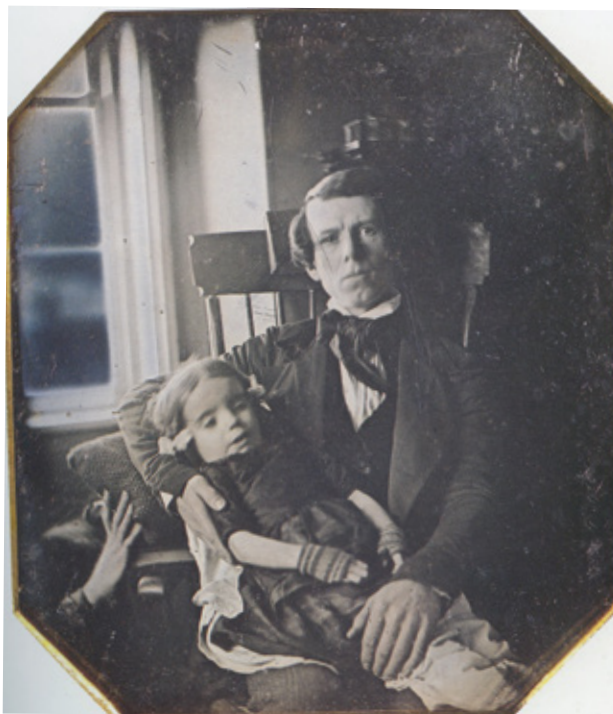
Daguerréotype , 1842 Un père et sa fille, anonymes, 9,75 cm x 10,80 cm

Ces moments où l'écriture est marquée par les listes, la parataxe, les redondances et les répétitions à la Tarkos ou à la Beckett sont peu nombreux, mais font pencher le récit vers la poésie lorsque l'inquiétude s'empare de la narration. La voix d'Anne-Renée Caillé est souvent celle de son sujet, et ce sujet est rarement elle-même, ce qui frappe d'autant plus fort lorsqu'elle verse dans ces tentatives d'épuisement du langage qui révèlent les angoisses de la narratrice. Ce travail patient et minutieux de la mise en récit est un coup de maître. Alors que le lecteur entre dans le texte pour entrevoir cet univers mis à distance par les sociétés modernes, les peurs ataviques finissent par ressurgir. La fatalité touche aussi les personnages, et on se prend à regarder derrière notre épaule et celle de nos proches, à se dire que nous n'en avons pas fini avec la mort, et qu'elle non plus n'en a pas fini avec nous. ■