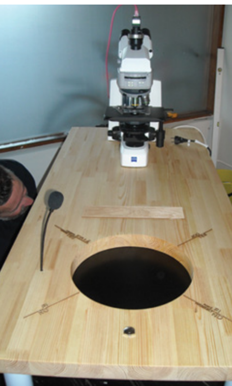
Your Synthetic Future (at the speed of light) Installation (vue de dessus)

visualiser un ensemble de créatures synthétiques présentées comme des chaînes de symboles adaptés du lexique iconographique d'un logiciel libre d'édition d'ADN (du type CrispR, mais non propriétaire). Erich Berger a programmé les créatures en question à l'aide des logiciels adéquats afin qu'elles évoluent dans le milieu numérique rendu présent par la médiation d'un ordinateur personnel minimal, lui aussi installé sous la table. Enfin, la table est équipée d'un microphone avec interrupteur, et le trou de l'écran est orné, sur ses bords, d'inscriptions en anglais et en finnois qui se traduisent par «oui», «non», «peut-être que oui» et «probablement pas». Un manuel qui indique les instructions rudimentaires pour interagir avec l'œuvre est aussi disposé sur la table, au-dessus du trou.