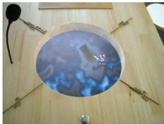
Your Synthetic Future (at the speed of light) Détail de l'installation

L'écran évoque le puits de divination des pratiques chamaniques scandinaves (en particulier norvégiennes) connues sous le nom de seidh ou seidhr . Les quatre inscriptions autour de l'écran rappellent une version élémentaire du ouidja utilisé dans les séances de spiritisme. L'installation est aussi conçue pour évoquer, sous une forme technoscientifique contemporaine, les machines prophétiques que l'on retrouvait, il n'y a encore pas si longtemps, dans les fêtes foraines où, contre très peu d'argent sonnante et trébuchante, le visiteur pouvait trouver instantanément réponse à ses questions concernant son futur.