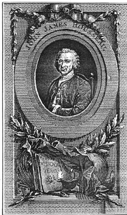
Figure 1: Portrait de John James Rousseau. Recueil des œuvres de musique de J. J. Rousseau (1788-1793), page frontispice.