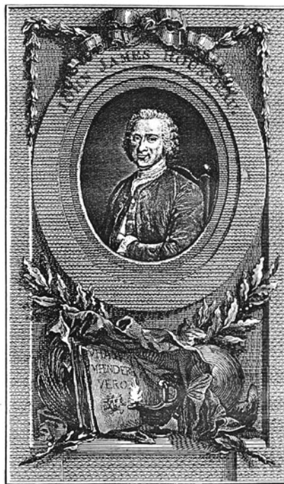
Figure 1: Portrait de John James Rousseau. Recueil des œuvres de musique de J. J. Rousseau (1788-1793), page frontispice.

Page frontispice: portrait en médaillon surmonté de l'inscription « John James Rousseau » (voir figure 1).