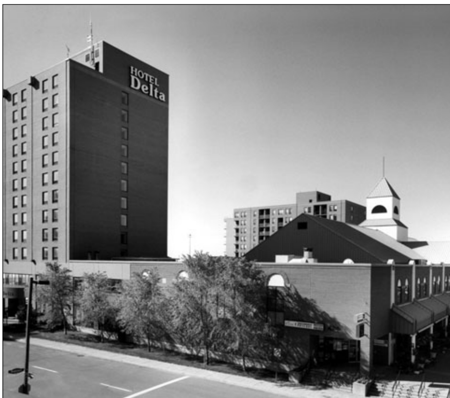
Le Delta de Trois-Rivières.

Les hôtels Delta sont une chaîne de 38 hôtels au Canada, dont cinq au Québec, répartis dans les principales grandes villes de