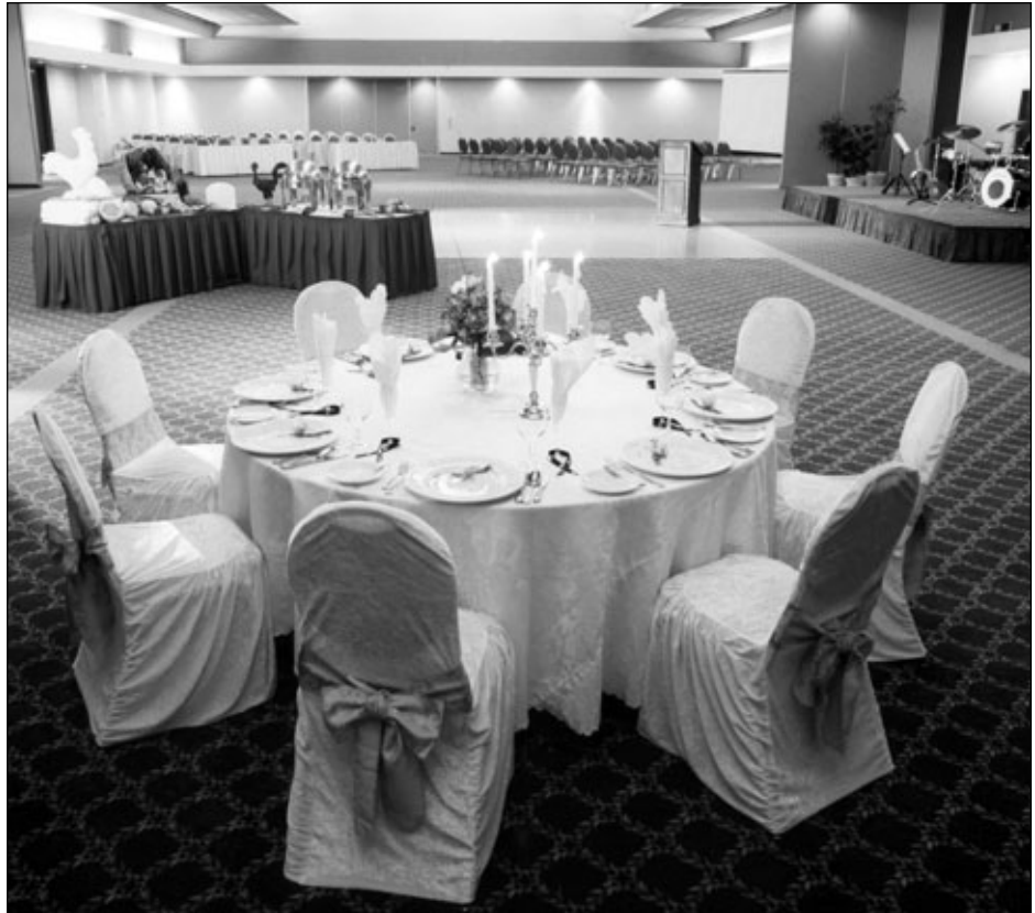
Salle de banquet de l'hôtel Delta à Trois-Rivières.

Cette mise en situation était indispensable pour connaître l'entreprise rencontrée et son directeur général. Passons maintenant à la présentation de la stratégie de communication à proprement parler, en commençant par les cibles de la communication, comme nous l'avons présenté dans notre modèle.