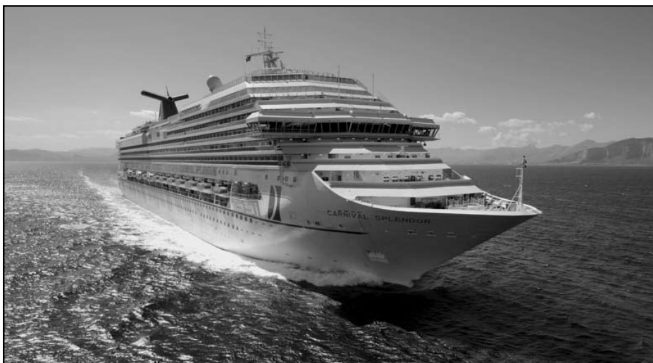
Illustration 1 : Le Carnival Splendor .

Le navire de croisière fascine. Pas surprenant, ces complexes touristiques constituent les plus grandes infrastructures mobiles de fabrication humaine (ill. 1). Symboles du perfectionnement de l'ingénierie et du besoin humain de conquête au-delà des continents, ils marient