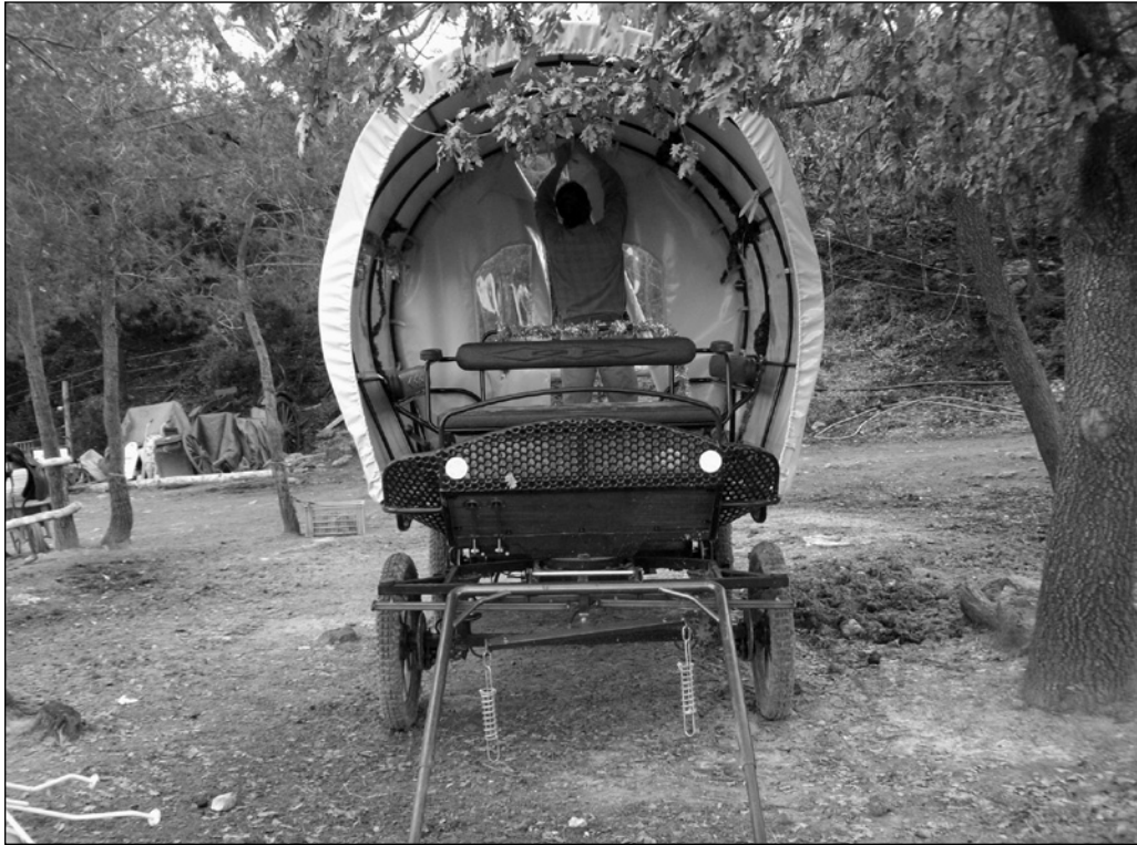
ILLUSTRATION 2 : Calèche adaptée aux fauteuils roulants.

durabilité génériques. Ces derniers sont ensuite déclinés en 65 critères opératoires dans la grille d'évaluation, une moitié portant sur des questions environnementales et l'autre moitié, sur des aspects économiques et socioculturels.