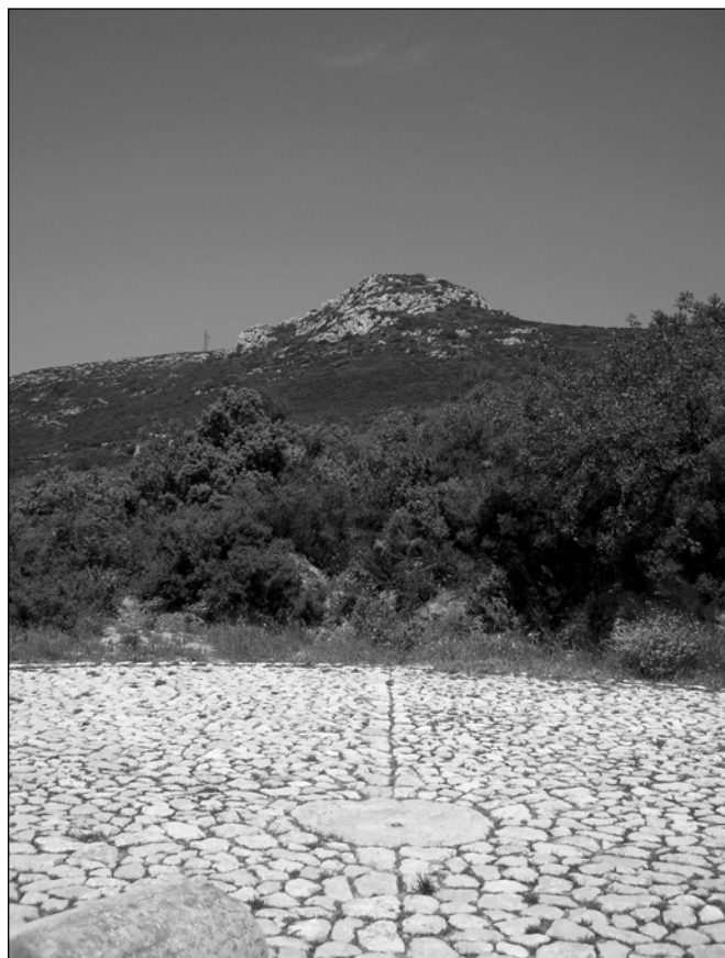
ILLUSTRATION 1 : Le Garlaban depuis la Font de Mai.

développement territorial. L'expérimentation présentée dans cet article s'est déroulée entre 2007 et 2010 sur le territoire de la communauté d'agglomération du Pays d'Aubagne et de l'Étoile (PAE, désormais), situé dans une région très touristique du cœur de la Provence, rendue célèbre par les ouvrages de Marcel Pagnol, entre Marseille et Aix-en-Provence (voir illustration 1). Ce territoire a été reconnu « agenda 21 local France » en début 2007.