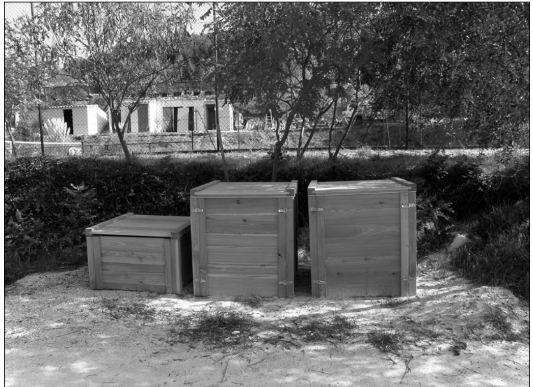
ILLUSTRATION 4 : Composteur sur mesure pour restaurant.

la démarche exerce une activité polluante. S'il doit fermer son atelier, ses ouvriers perdront leur emploi. Conscient des enjeux économiques, sociaux et environnementaux que représente son activité pour le territoire, cet artisan a accepté de livrer une information transparente aux responsables de la démarche EVEIL afin de recevoir un accompagnement adapté et de progresser vers des pratiques moins polluantes.