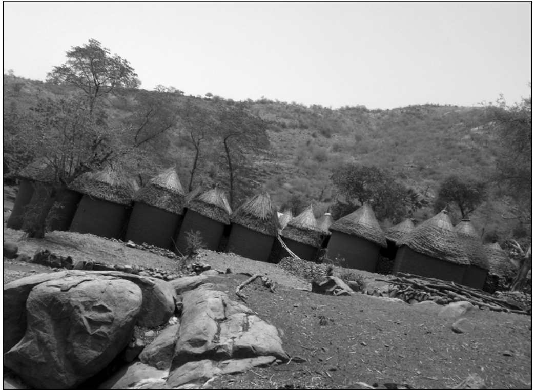
ILLUSTRATION 1 : Vue d'une concession mouktélé dans les monts Mandara.

l'organisation intérieure des concessions sont une matérialisation de la hiérarchie sociale entre l'homme et la femme. La partie haute de la maison s'oppose à sa partie basse comme le masculin s'oppose au féminin. L'architecture montagnarde conditionne en outre le rapport de ses occupants avec le monde extérieur. Pour l'homme, la maison représente un lieu qu'il quitte pour affronter les dangers du monde extérieur alors que pour la femme elle est un lieu dans lequel celle-ci demeure en permanence. Cette idée rejoint étrangement l'analyse faite par Pierre Bourdieu (1970) de la maison kabyle. Ces caractéristiques confèrent à l'architecture un potentiel touristique, et la visite de l'intérieur des concessions est une étape importante de l'itinéraire touristique des monts Mandara (voir illustration 1).