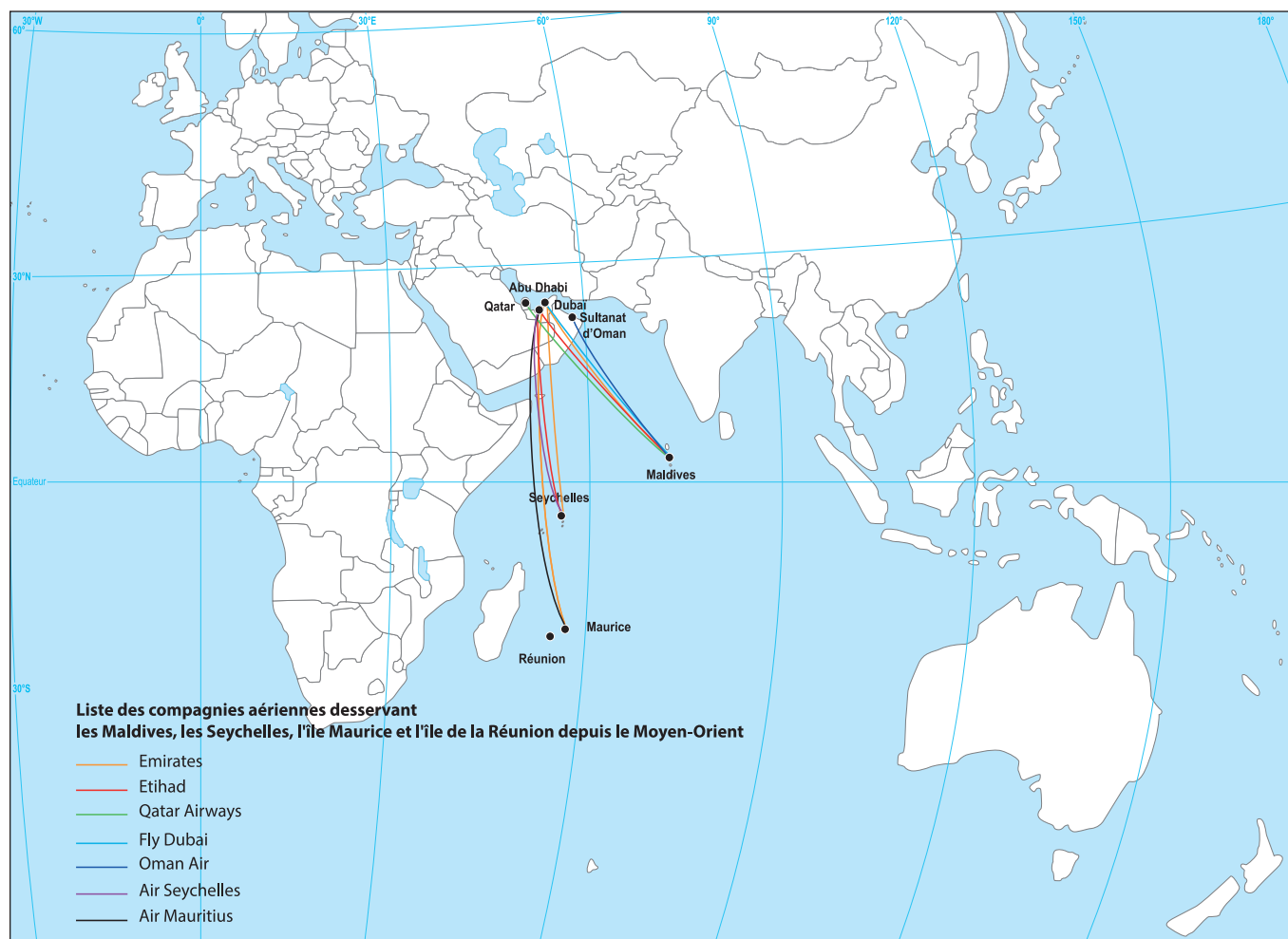
ILLUSTRATION 2 : Liaisons aériennes entre le Moyen-Orient et les Maldives, les Seychelles, l'île Maurice et l'île de la Réunion.

l'arrêt des vols directs par Air Seychelles et Air France. Même lorsqu'Air Seychelles lance une politique de communication en juillet 2014 pour annoncer son retour à Paris, cela reste un vol par correspondance, via Abu Dhabi, (illustration 2). L'aéroport de la capitale des Émirats Arabes Unis joue à plein son rôle d'aéroport de correspondances ( hub ) en massifiant les flux venus de pays et continents différents puis en les redirigeant vers la destination finale en s'assurant ainsi un bon taux de remplissage. L'omniprésence d'Etihad aux Seychelles a aussi entraîné l'arrêt en septembre 2013 des vols de Qatar Airways. Le modèle est donc particulièrement efficace même s'il se fait au détriment de liaisons directes.