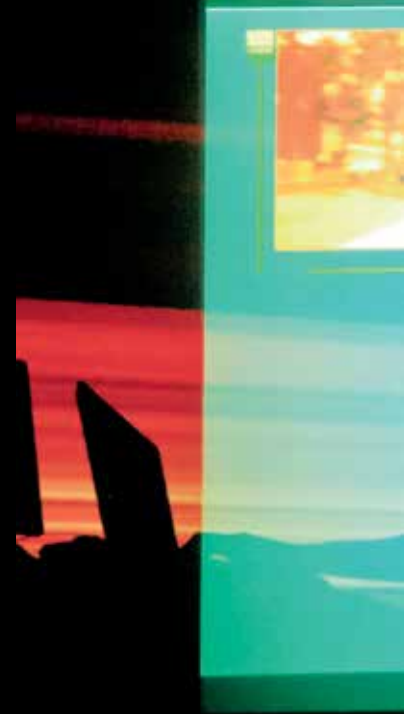
Contact, performance médiatique, Hp Process, Société des arts technologiques, 2013.