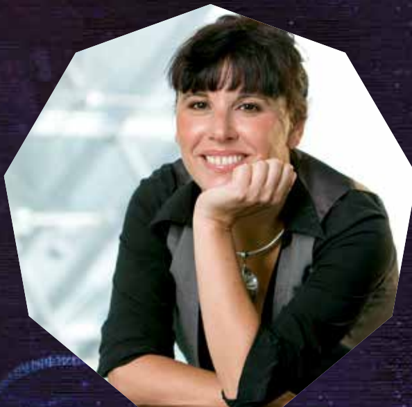
Illustration : Nasim Abaeian >>>