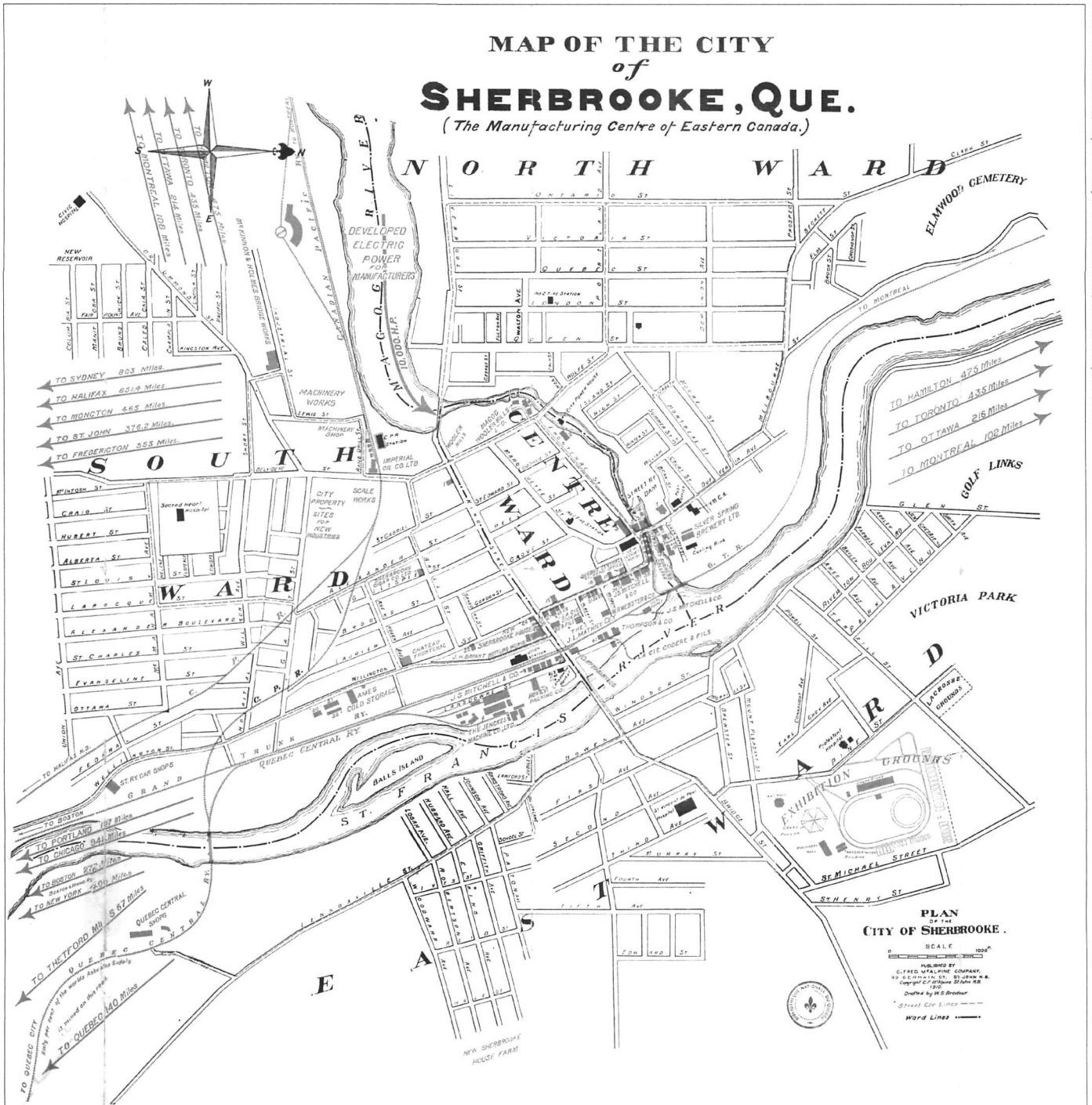
Figure 1 : Les quartiers et les rivières de Sherbrooke.

piéd, un corridor industriel est mis en place autour des chutes de la Magog dans la seconde moitié du XIX e siècle. Le développement de la ville de Sherbrooke prend appui sur ce corridor, alors que la rivière et l'énergie qu'elle transporte jouent un rôle structurant et façonnent le territoire urbanisé. Le corridor industriel et la rivière qui le traverse séparent nettement la ville en deux quartiers denses, aux bâtiments agglutinés, avec