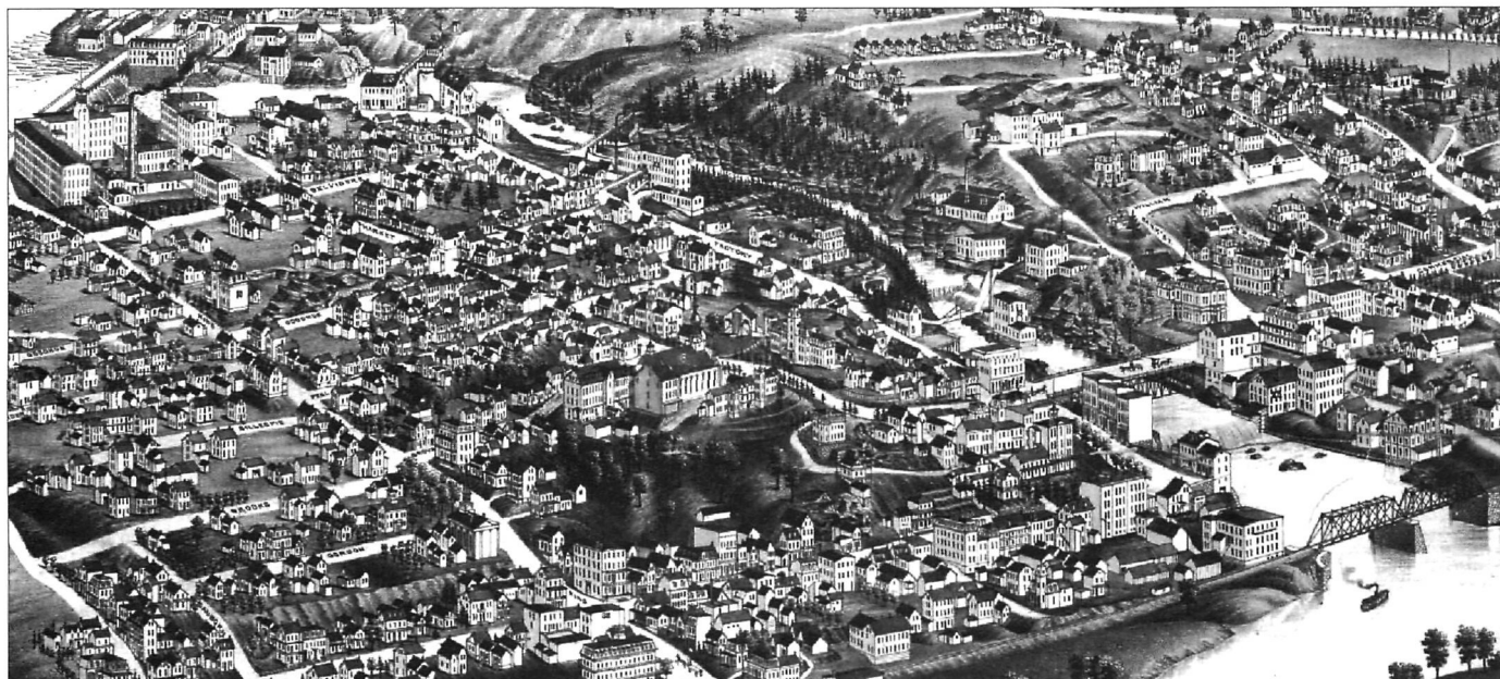
Extrait de H. Wellge, Bird's Eye View of Sherbrooke P. O. Madison, J.J. Stoner, 1881.