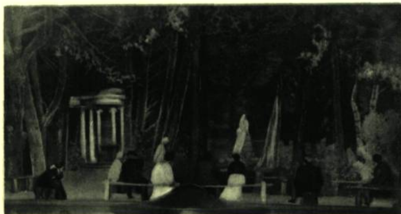
Décor de « LA MOUETTE » dans une mise en scène de Stanislavski et Nemirovitch-Dantchenko.

Ce silence n'est pas cette impuissance à s'exprimer que ressentent les gens de condition modeste et ceux à qui les malheurs de cette vie ont appris à se taire. Il n'est pas absence mais prolongement de la parole, car, nés bavards comme savent l'être les slaves, les personnages de Tchekhov deviennent... silencieux sous le fardeau progressif de leur drame intérieur. L'action extérieure s'y ralentit. Pourquoi agir ? se disent tant de silencieux, notre peine nous agite que trop. Et quel personnage n'a pas sa peine à cacher, à montrer ? Il la garde jusque dans sa joie, elle éclate avec son rire. Cette lassitude que tous éprouvent, cette langueur physique qui leur est si communicative font que la pièce s'immobilise. Ce théâtre est un long temps d'arrêt. On en perçoit que mieux les battements de tous ces coeurs pensifs qui ne savent plus ce qu'ils ont à faire ou à dire. Tous attendent que le rideau se baisse pour n'avoir plus à prononcer des paroles qui ne « passent plus » tant l'émotion les étirent. Le silence qui succède à Mozart est encore de Mozart, disait Sacha Guitry. On pourrait dire pareillement de Tchekhov que le silence qui lui succède est encore de Tchekhov. Pour la première fois, au théâtre, le silence continue de nous parler.