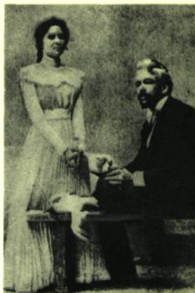
Roxanova et Stanislavski dans « LA MOUETTE ».