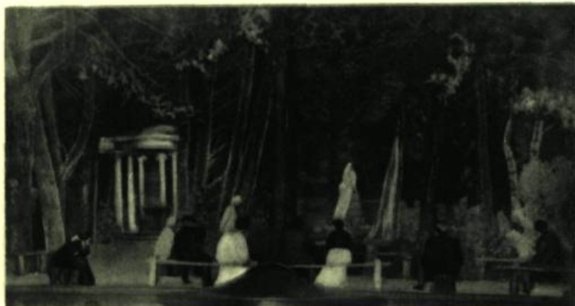
Décor de « LA MOUETTE » dans une mise en scène de Stanislavski et Nemirovitch-Dantchenko.

Ce silence n'est pas cette impuissance à s'exprimer que ressentent les gens de condition modeste et ceux à qui les malheurs de cette vie ont appris à se taire. Il n'est pas absence mais prolongement de la parole, car, nés bavards comme savent l'être les slaves, les personnages de Tchekhov deviennent... silencieux sous le fardeau progressif de leur drame intérieur. L'action extérieure s'y ralentit. Pourquoi agir ? se disent tant de silencieux, notre peine nous agite que trop. Et quel personnage n'a pas sa peine à cacher, à montrer ? Il la garde jusque dans sa joie, elle éclate avec son rire. Cette lassitude que tous éprouvent, cette langueur physique qui leur est si communicative font que la pièce s'immobilise. Ce théâtre est un long temps d'arrêt. On en perçoit que mieux les battements de tous ces coeurs pensifs qui ne savent plus ce qu'ils ont à faire ou à dire. Tous attendent que le rideau se baisse pour n'avoir plus à prononcer des paroles qui ne « passent plus » tant l'émotion les étirent. Le silence qui succède à Mozart est encore de Mozart, disait Sacha Guitry. On pourrait dire pareillement de Tchekhov que le silence qui lui succède est encore de Tchekhov. Pour la première fois, au théâtre, le silence continue de nous parler.