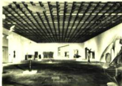
Nouveau Musée Whitney d'Art américain à New York. Marcel Breuer et Associés, architectes.

Vue du pont de béton au-dessus du jardin de sculptures.