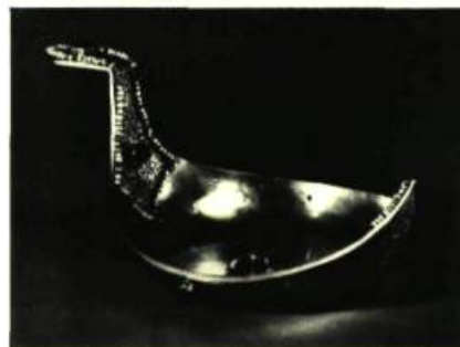
1—Pierre Kontchalovsky. Portrait du peintre Iakoulov (1910). Galerie Tretiakov.