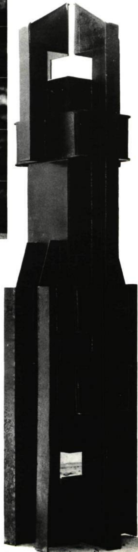
ROUMANIE. Ritz-Victoria et Peter JACOBY. Objet de jeu, 1969. Textile. NORVÈGE. Arnold HAUKELAND. Sculptures. (Phot. Randi Haukeland.) CANADA. Michael SNOW. Atlantic, 1966/67. (Phot. Giacomelli, Venise.) SUISSE. Jean-Édouard AUGSBURGER. Gravure en relief, 1970. AUTRICHE. Bernard MOSWITZER. Grande figure, 1967. (Phot. Giacomelli, Venise.)