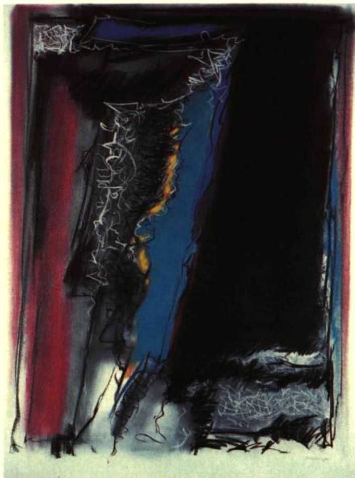
2. Zones magnétiques, 1981.

Mais ce sont les possibilités proprement plastiques de ces masses qui absorbent bientôt toute l'attention de Bellerive,