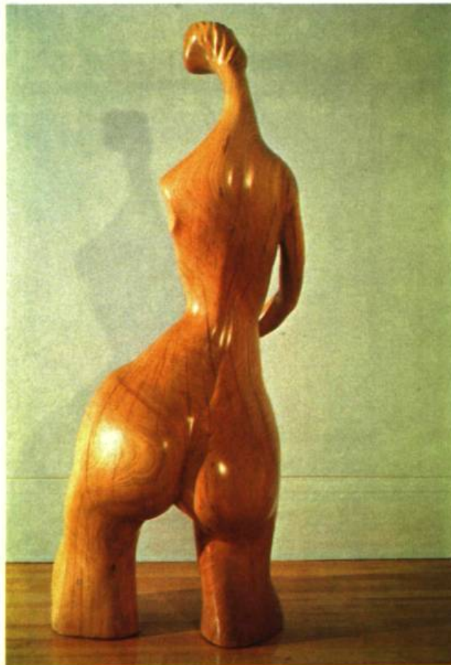
2. Femme N° 1. Bois d'orme; H.: 172 cm 7.