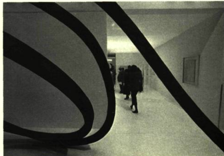
1. L'entrée du stand de la Galerie Denise René/Hans Meyer, avec au premier plan une sculpture de Barnar VENET.

Cette année, le Salon avait beau arborer un slogan plutôt frondeur - The Art Adventure! -, il reste que les communiqués de presse étaient plus pondérés: «Dans le secteur de l'avant-garde, la situation est marquée par l'inertie; après l'explosion expressionniste (depuis le début de la décennie), on est dans l'attente de nouvelles tendances. Les nouveaux fauves allemands et les néo-expressionnistes italiens demeurent, cette année encore, les mieux placés...» Il est vrai que, dans l'ensemble, le groupe des nouvelles vedettes ressemble à celui des anciennes comme deux gouttes d'eau. En quoi l'Art 16'85 se contentait de refléter les tendances dominantes (du marché) et ne s'aventurait guère à en suggérer de nouvelles. Comme si tout le monde ressentait le besoin de respirer un peu.