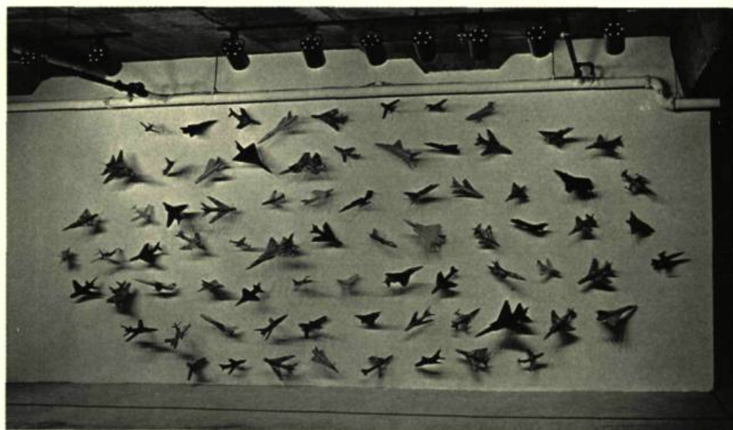
1. Robert ADRIAN 76 Airplanes , 1985.

Ainsi l'espace s'allie-t-il à l'œuvre-installation, d'une part, en la déterminant et, d'autre part, en circonscrivant le lieu de déambulation du spectateur. Il s'agit donc d'un espace clos: d'où l'assignation des emplacements respectifs à l'intérieur desquels séjournent les œuvres. Dans plusieurs cas, les œuvres restreignent le spectateur puisqu'elles l'obligent à un parcours ( The Photographer , de David Tomas) ou à une vision frontale qui rappelle effectivement l'utilisation classique de l'espace théâtral délimité par le rapport scène/salle ( Un espace , de Pierre Granche). Ces espaces se caractérisent par leur non-objectivité, leur nature imparfaite et brute, évoquant l'industrialisation et, surtout, une ouverture sur la vie d'une