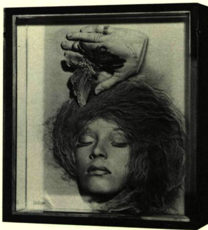
1. Jennifer DICKSON The Captive, 1975, et retravaillé en 1979. Visage de femme, main d'homme, papillon; boîte en bois polychrome avec éléments encastrés, plumes, cheveux et miroirs; 44cm 4 x 40,6 x 12,7.

Pourtant, le titre qu'elle a choisi pour la première exposition rétrospective de son œuvre est empreint d'un certain regret, d'un certain ressentiment. En effet, l'autre Jennifer Dickson évoque le fait qu'un artiste peut être catalogué de telle façon que son travail restera ignoré. Il y a beaucoup de vrai dans cette déclaration. Dans les cercles artistiques, nombreux sont ceux qui, instinctivement, pensent connaître son œuvre lorsque son nom surgit au détour d'une conversation; pourtant, rares sont les familiers de l'ensemble de son travail. Quoique limitée, cette sélection, tout à la fois ramassée et fascinante de ses œuvres maîtresses couvrant diverses périodes, suggère efficacement sa démarche, illustrant le jeu de relations qui, d'un thème à l'autre, nourrit la force d'évocation de son travail.