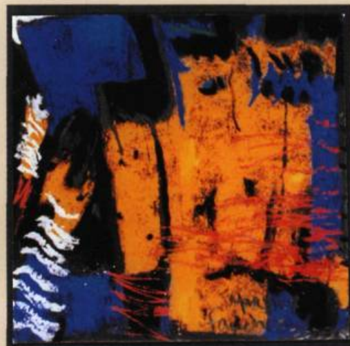
Lueurs abstraites, 2000 Pastel sec sur papier émeri 7,5 X 7,5 cm

Adoptant tantôt la miniature, tantôt le grand format, Marylène Faucher utilise des techniques mixtes incorporant, entre autres, le pastel, l'acrylique, l'encre, le plomb et le bronze pour explorer les notions de temporalité et de mémoire.