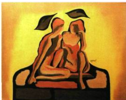
Marielle Pesant Tendre regard , 2001 Acrylique 61 X 76,2 cm