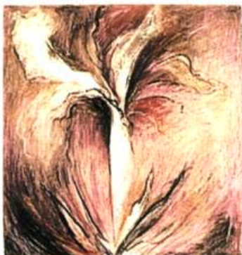
Lauréat Marois Iris 1 , 1992-93 Techniques mixtes sur papier fort 46 X 41 cm Collection Prêt d'œuvres d'art, Musée du Québec, Québec.