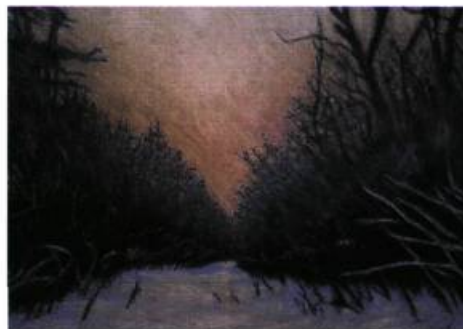
Julie Morin Matin d'hiver Pastel sur papier apprêté 27,5 X 45 cm Exposition Ode hivernale