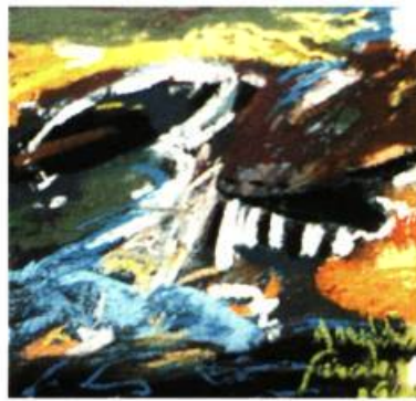
Marylène Faucher Le barrage, Puissance sourde , 2000 Pastel sec sur papier émeri 7,5 X 7,5 cm