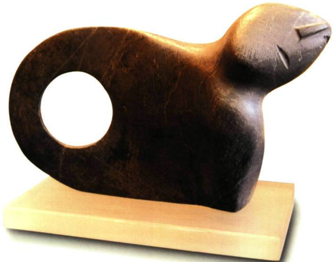
George Arluk (né en 1949) Baker Lake Figure , 1979 Stéatite noire 10,5 x 17 x 3 cm Guilde canadienne des métiers d'art du Québec