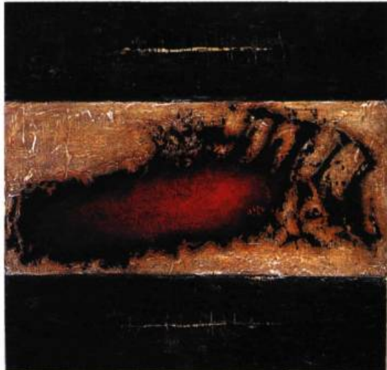
Redbone, 2001 Acrylique sur bois 122 x 122 cm

Trahissant l'attitude du romantisme engagé, Bill Vincent recherche dans les styles et les dogmes du passé, les survivances et les renaissances esthétiques et allégoriques.