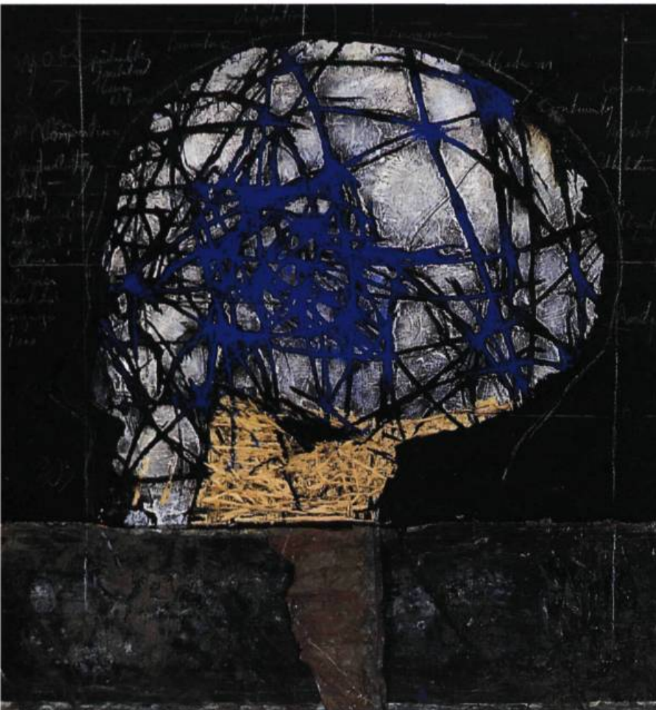
Vanitas (Memento mori) , 2001 Acrylique et goudron sur bois 125 x 120 cm