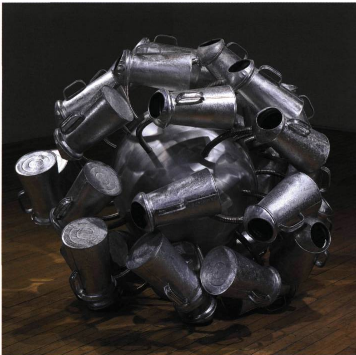
Débordement , 2001 Aluminium, acier galvanisé 99,5 x 131,5 x 123,5 cm

d'entonnoirs et de récipients. Par de tels assemblages, l'artiste évite toute catégorisation et oblige les formalistes et leurs détracteurs à s'asseoir à la même table. Ainsi, en vertu d'une surprenante hybridation, Jean-Pierre Morin élabore une plastique insoumise qui, sous une apparente dérision, révèle une profonde réflexion sur la discipline sculpturale.