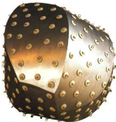
Taiwan 1 3/4 , 2001 Aluminium, caoutchouc, acier 107 x 120 x 78 cm