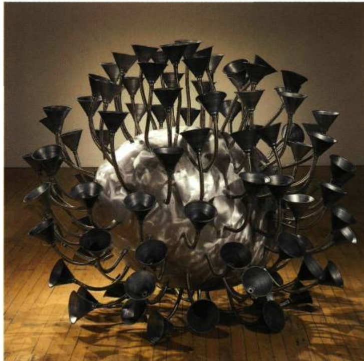
Déversement, 2001 Aluminium, acier galvanisé 165 x 150 x 150 cm

Le sculpteur se plaît depuis longtemps à déjouer les apparences avec de curieuses compositions dont la trompeuse simplicité dissimule une complexité inattendue. Après